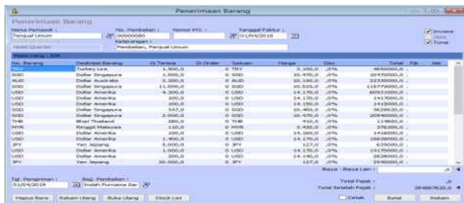
Gambar 13. Jendela Transaksi Pembelian

Apr 01. Dibeli barang dagangan dari Penjual Umum sejumlah Rp. 284.887.620