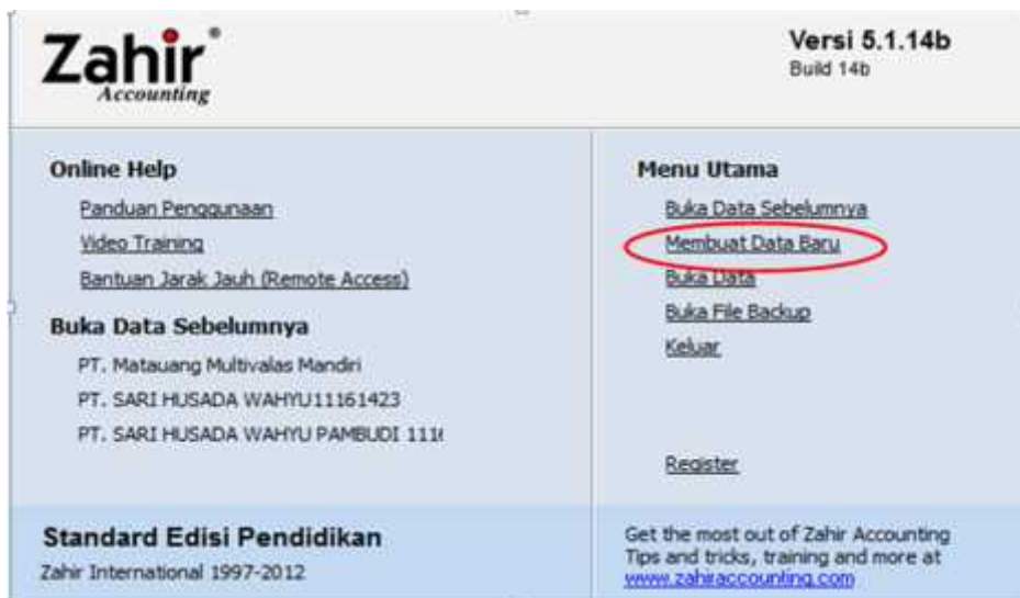
Gambar 2. Jendela Menu Utama Zahir