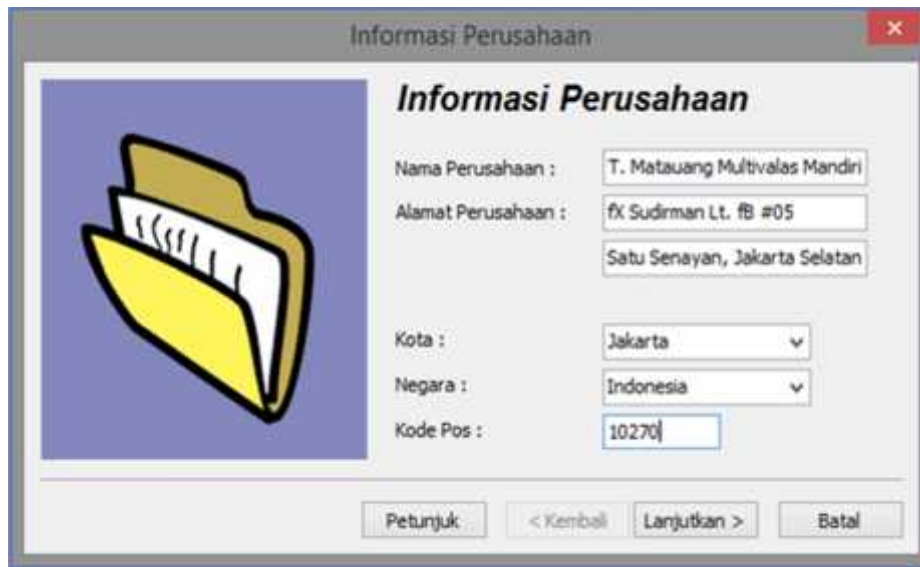
Gambar 3. Jendela Penginputan Informasi Perusahaan