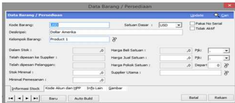
Gambar 10. Jendela Data Barang

Untuk membuat data produk, pilih data-data, pilih data produk, dan isikan data sebagai berikut: