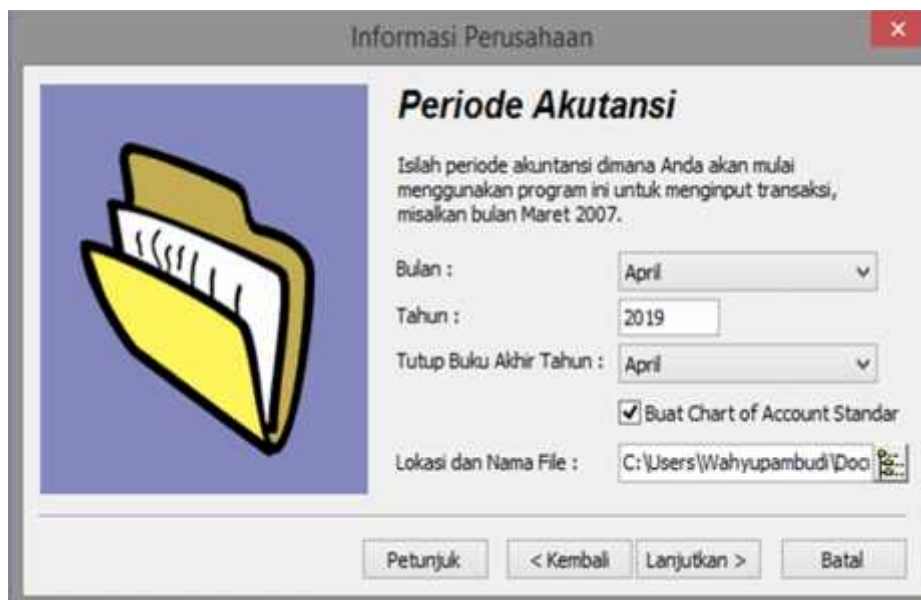
Gambar 4. Jendela Penginputan Periode Akuntansi