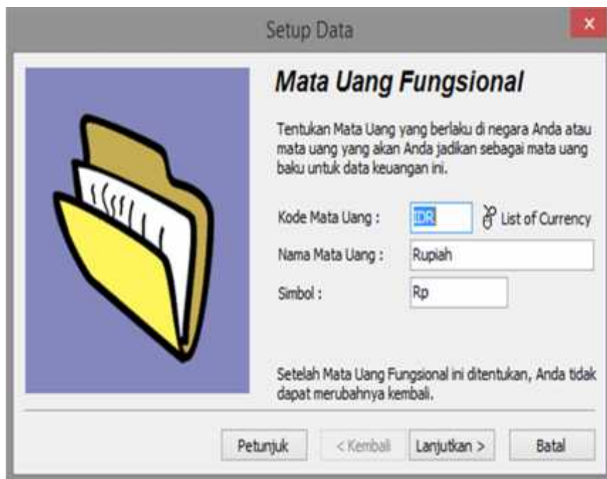
Gambar 6. Jendela Pemilihan