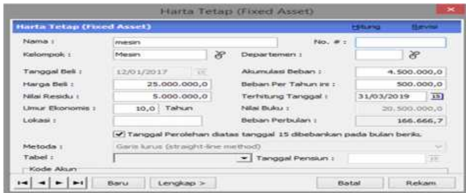
Gambar 12. Jendela Harta Tetap

b. Kemudian buat data harta tetap, pilih data harta tetap, dan isikan data sebagai berikut: