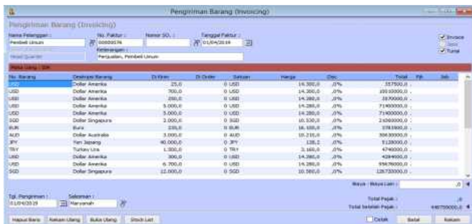
Gambar 14. Jendela Transaksi Penjualan

Apr 01. Dijual barang dagangan kepada Pembeli Umum sejumlah Rp. 448.759.000