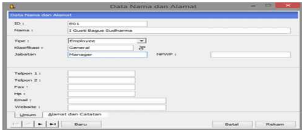
Gambar 9. Jendela Data Nama Dan Alamat Pegawai