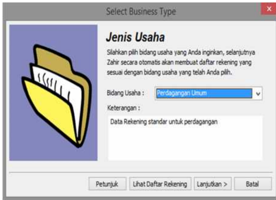
Gambar 5. Jendela Pemilihan Bidang Usaha